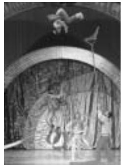
レニングラード国立舞台サーカス