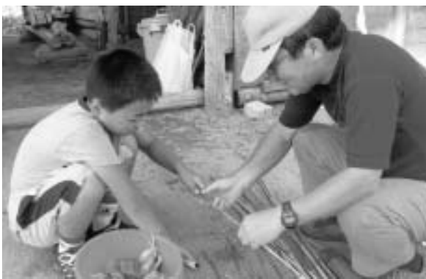
里山でクラフト作りに挑戦(昨年)