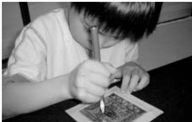
ガスエネルギー館での教室の様子(昨年)