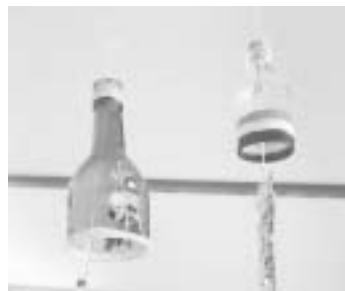
廃びんで作った風鈴