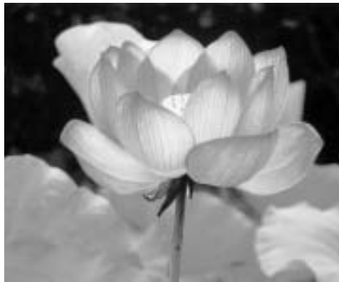
大賀ハスの花(薬王寺)