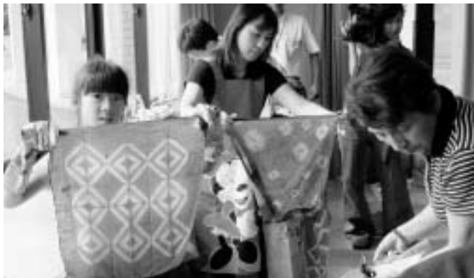
藍染めを楽しむ参加者(昨年)