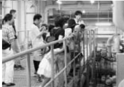
川合浄水場で水道水について学ぶ(昨年)▶