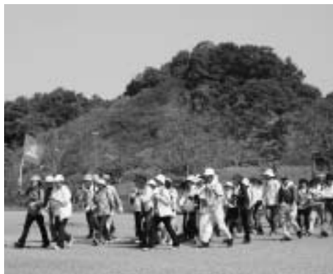
多くの参加者でにぎわった前回