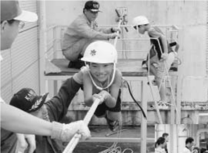
▲南消防署でのレンジャー体験(昨年)