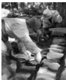
発掘はすべて手作業

石垣は、本丸を囲むすべての斜面で姿を現しました。石積みは上部や角はほかの部分と比べて保存状態が悪く、膨大な量の