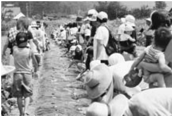
◀ジャガイモの種芋まき

市と和良夢づくり塾は、親子で楽しみながら農業体験などをする、「和良ふれあい農園」の参加者を募集します。