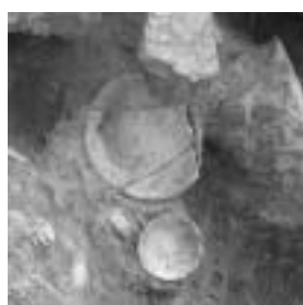
出土したばかりのカワラケ

本丸の整地された層や石垣に堆積した土の中から、城で使われていた「カワラケ」と呼ばれる素焼きの土器や天目茶碗、す