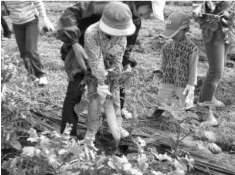
▲親子大きなダイコンを収穫