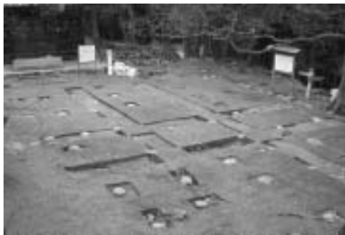
本丸の建物の跡。丸い石が礎石

調査は、昨年11月初旬から2月初旬までの約3カ月間で行われました。その結果、建物の跡や隠れていた石垣が姿を現し、