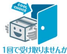
1回で受け取りませんか

宅配便の総数のうち約15%が再配達という調査結果があります。配達の際にもCO 2 は排出されます。日時指定や置き配、宅配ボックスなどを利用して、できるだけ1回で受け取りましょう。