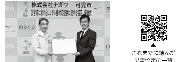
これまでに結んだ 災害協定の一覧

災害時におけるレンタル機材の提供に関する協定 相手方 株式会社ナガワ 締結日 令和3年12月1日 主要内容 災害時に、応急対応として必要となる仮 設ハウスや冷暖房機器など、同社が保有 する機材を優先的に提供いただく