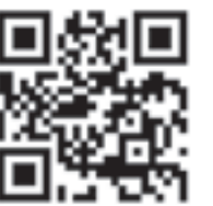
↑ イベントなどの 詳細はこちら

【市役所】〒509-0292 広見一丁目1番地 ☎②1111 ホームページ http://www.city.kani.lg.jp/