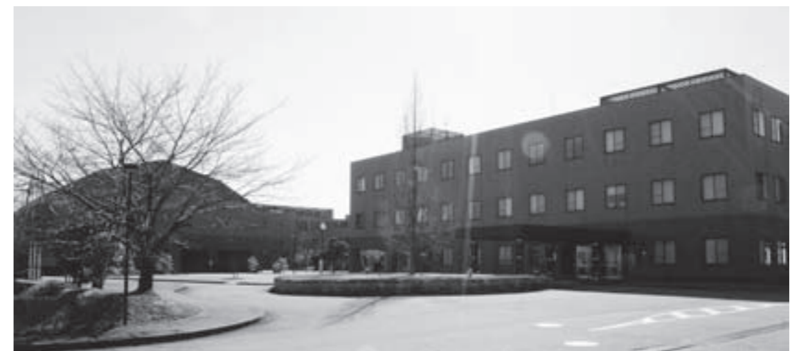
名城大学都市情報学部跡地

また、市民への学習機会の提供や地域活動への参加、大学施設の利用など、地域に根付いた大学として、まちづくりの一端を担っていただくためにも、可児キャンパスの開設が待たれます。