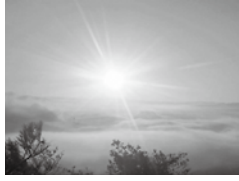
鳩吹山からの初日の出