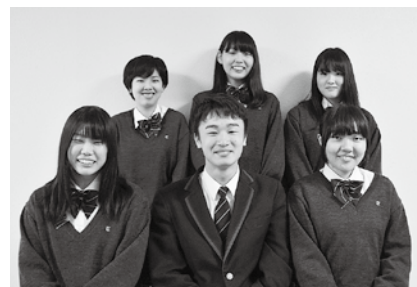
帝京大学可児高校

Q 選挙権を持ったら投票に行きますか？ A せっかくの権利だから、投票に行きます。 A 必ず行くとは言えません。あまり政治のことも知らない状態なので、これから考えます。 Q 投票に向けて準備していることはありますか？ A 候補者を選ぶ前に、まず自分の意見を持つことが大切だと思います。そのために、勉強だけでなく、いろんな考えを持つ人たちと話したりして、少しずつ自分の意見を持つようになりたいです。 Q 初めて投票する同世代にメッセージを！ A たった1票ですが、みんなが投票に行けば、大きな力になると思います。まずは投票に行ってみて、若い世代も頑張っていることをアピールしましょう。