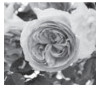
平成18年殿堂入りの Pierre de Ronsard (ピエール・ドゥ・ロンサール)