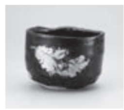
瀬戸黒金彩木葉文茶碗