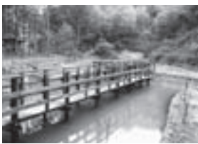
田んぼビオトープ