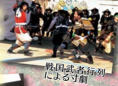
戦国武者行列 による寸劇