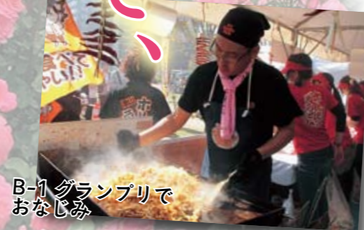
津山ホルモンうどん