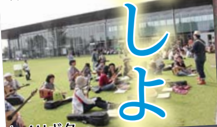
ギタリスト 「一五一会」 ワークショップ