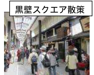
黒壁スクエア散策