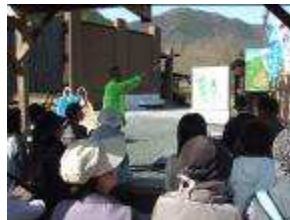
小谷城戦国歴史資料館